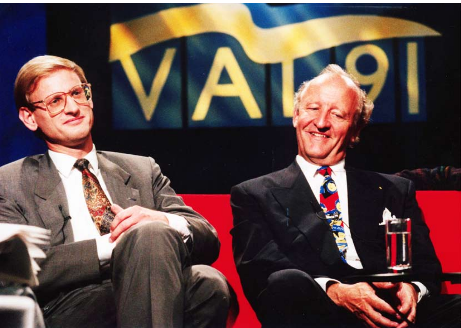
Två segrare i tevesoffan valnatten 1991 – den blivande regeringsbildaren Carl Bildt och Ian Wachtmeister från Ny Demokrati som hade fått 6,7 procent av rösterna. Ny Demokrati hölls utanför regeringen men hade en vågmästarroll fram till 1994 då partiet försvann ur riksdagen.